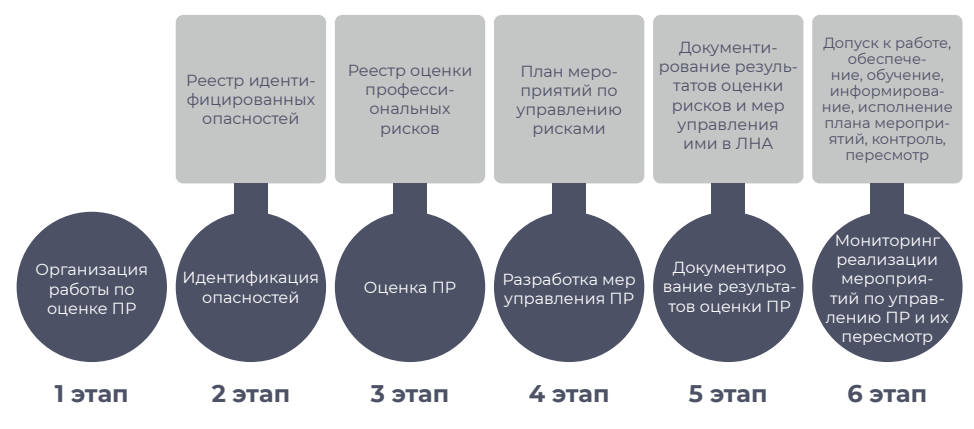
Рис. 4. Основные этапы оценки и управления профессиональными рисками

Рис. 4 демонстрирует ожидаемые результаты на каждом этапе реализации процедуры оценки и управления профессиональными рисками в рамках новой модели управления охраной труда, а выбор методов и способов их достижения определяет работодатель.