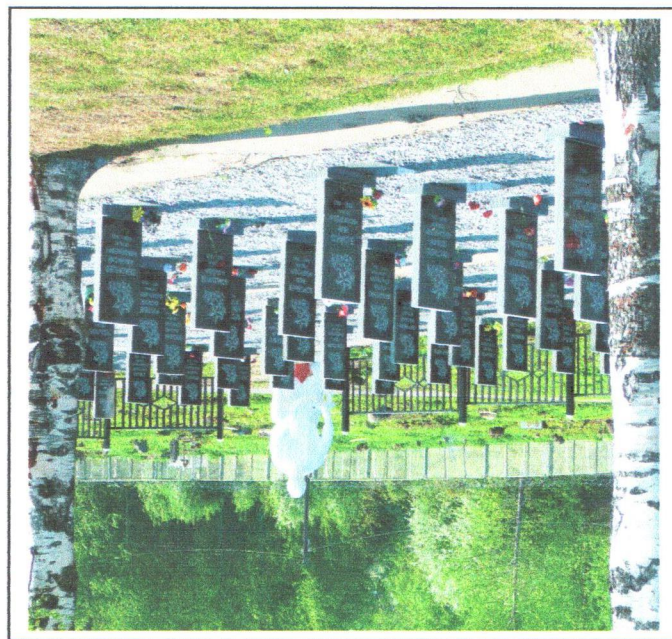
инэнэнодохэ о вивпмрфни кнчпгэтингопд' 11