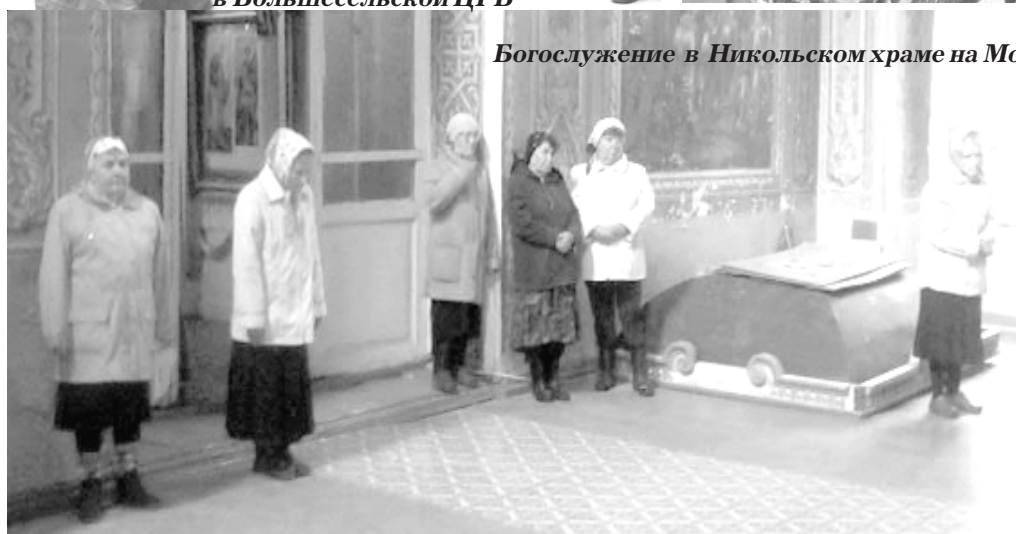
Богослужение в Никольском храме на Молокше