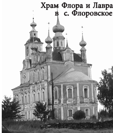
Храм Флора и Лавра в с. Флоровское