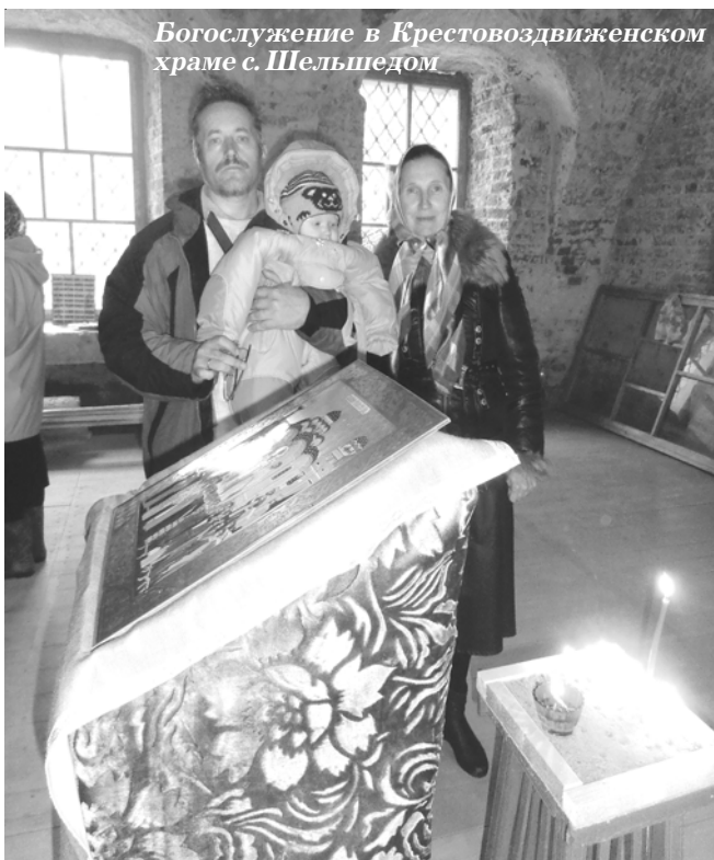
Богослужение в Крестовоздвиженском храме с. Шельшедом