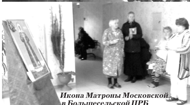
Икона Матроны Московской в Большесельской ЦРБ