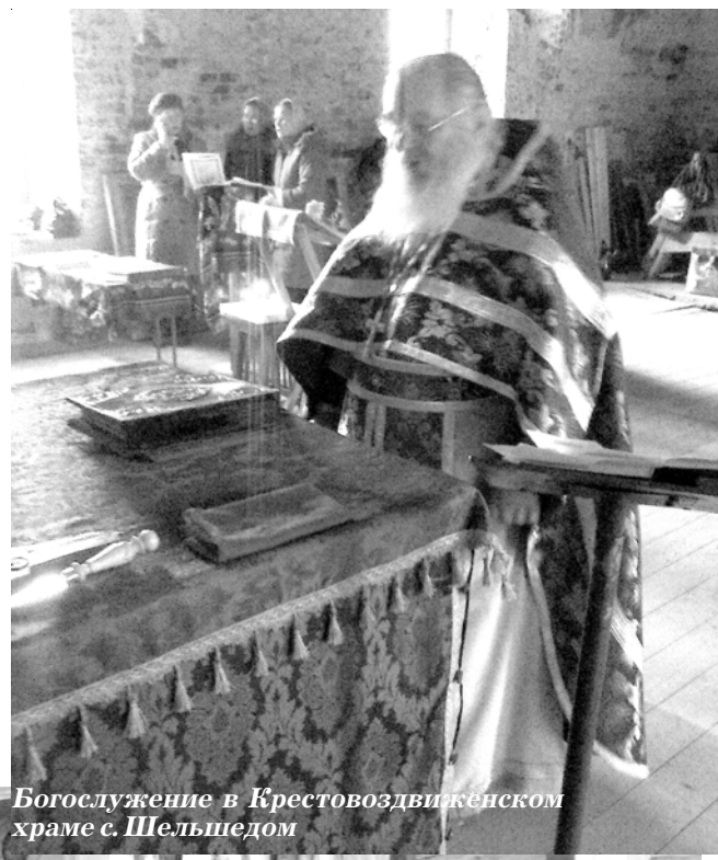
Богослужение в Крестовоздвиженском храме с. Шельшедом