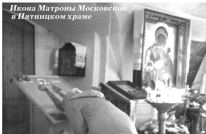
Икона Матроны Московской в Пятницком храме

зацвела сирень, которую прихожане при расчистке прилегающей к храму территории освободили из плена крапивы, борщевника и других сорняков. Целую седмицу в Пятницком храме находилась икона с частицей мощей блаженной Матроны Московской. Радует, что большесельцы помнят и любят Матронушку и многие пришли к ней помолиться. Молебен перед иконой Матронушки был совершен и в Большесельской больнице.