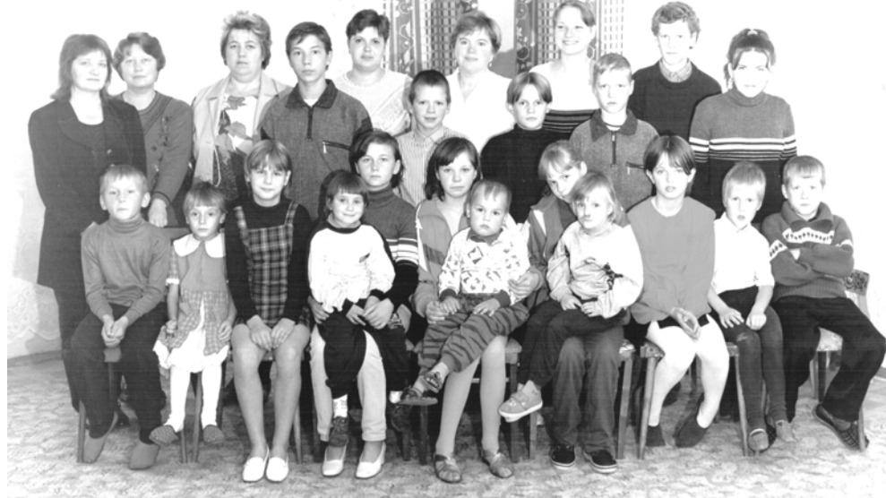
Коллектив "Колоска" с первыми воспитанниками

Так газета «Здоровье» 11 июля 2008 года, в статье к 15-летию центра писала: