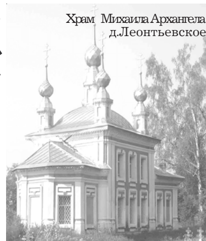
Храм Михаила Архангела д.Леонтьевское