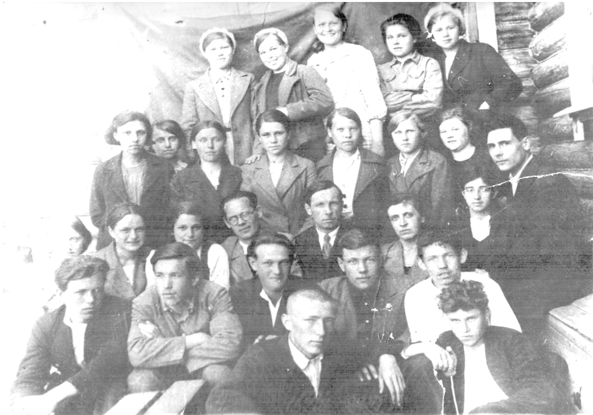
Фото 1941 года - выпускники Вареговской школы...