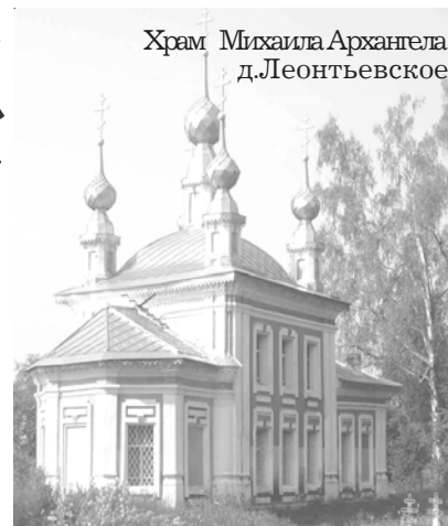
Храм Михаила Архангела д.Леонтьевское

К 80-ЛЕТИЮ ОБРАЗОВАНИЯ БОЛЬШЕСЕЛЬСКОГО РАЙОНА 1935-2015