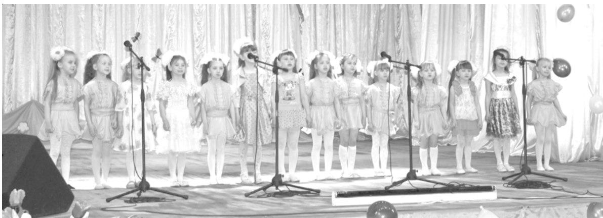
На снимках: моменты праздника «Не ярмарка, не карнавал, а праздник детства всех собрал»