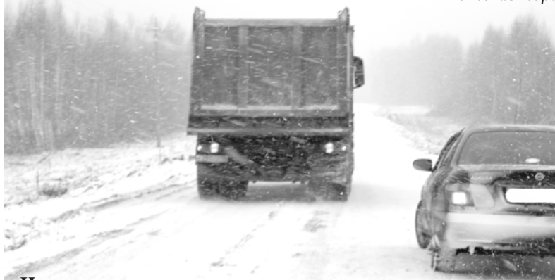
На участке реконструкции