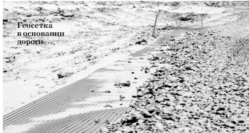
Геосетка в основании дороги

вопрос откладывался на годы и даже десятилетия. Время от времени вроде бы что-то просматривалось, и казалось, что вот-вот начнется строительство, но всегда что-то мешало. А в марте 2013 года наш район с визитом посетил