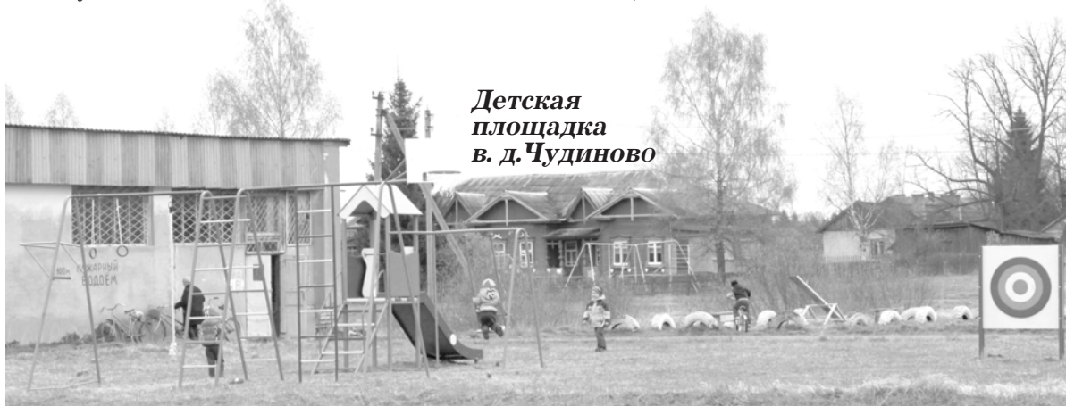
Детская площадка в д. Чудиново