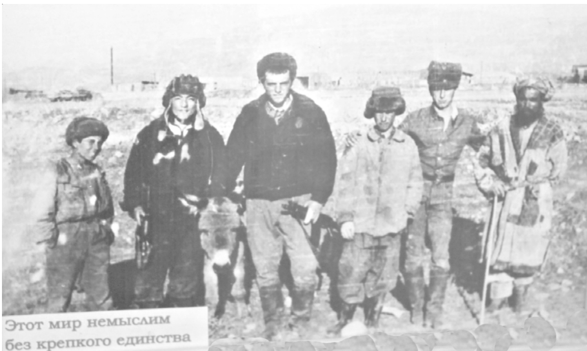
Этот мир немислим без крепкого единства

снова соберутся все вместе, чтобы вспомнить тех, кого уже нет, спеть и послушать «афганские» песни, которые полны трагизма, но говорят о светлом завтра, наполнены отвагой и мужеством, поговорить за жизнь.