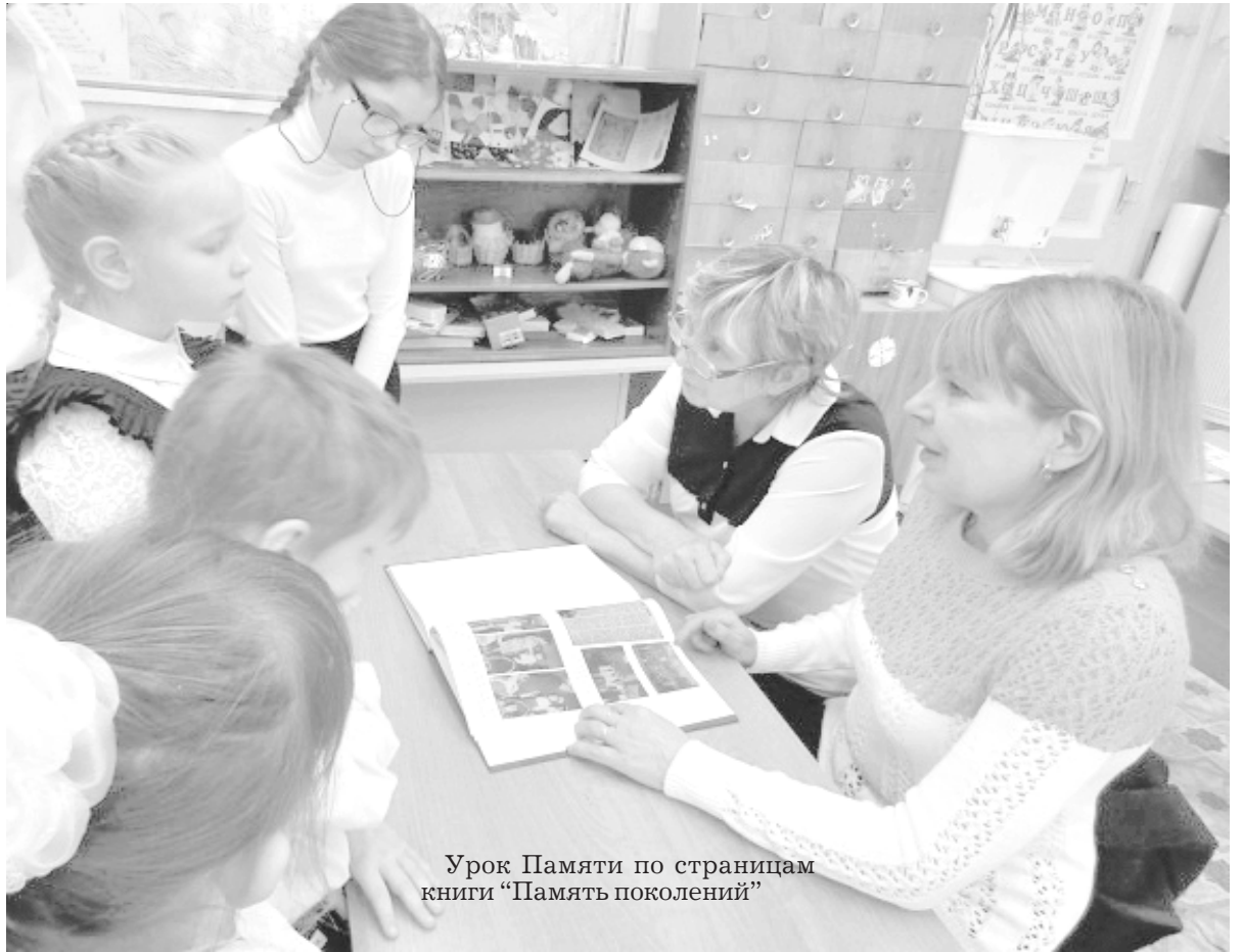
Урок Памяти по страницам книги «Память поколений»

Как жаль, что нельзя именно им вместе всем и каждому в отдельности сказать, что мы не