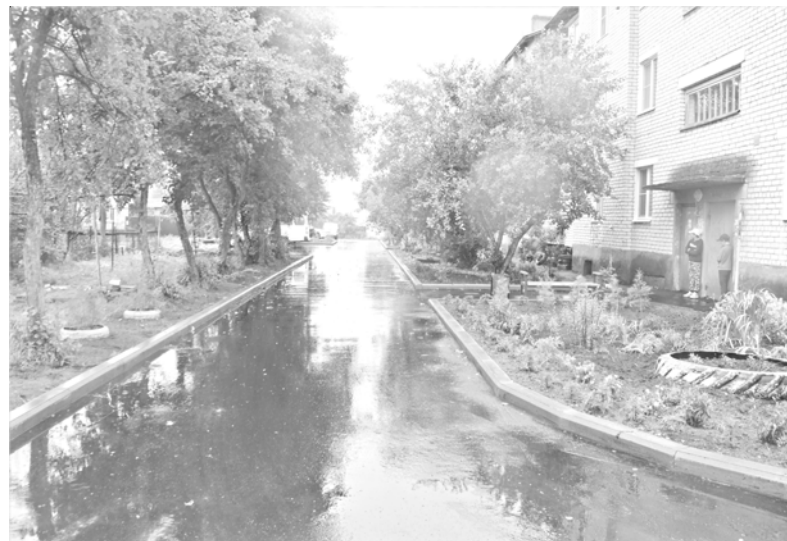
с.Большое Село, ул.Сурикова, д.10а