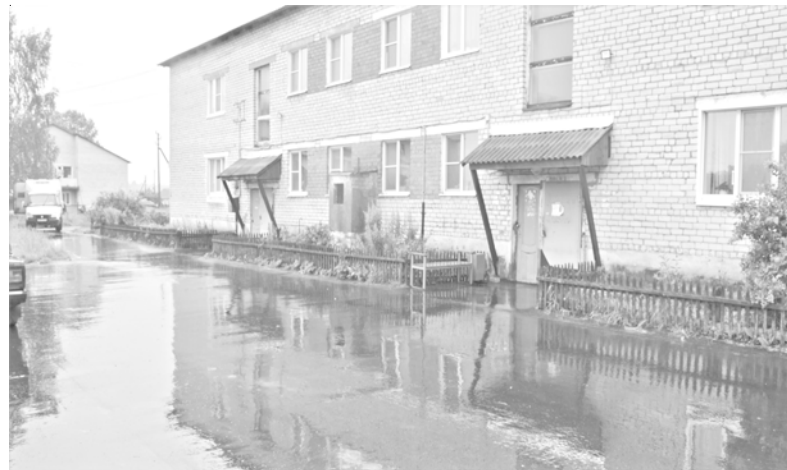
с.Большое Село, ул.2-я Полевая, д.32