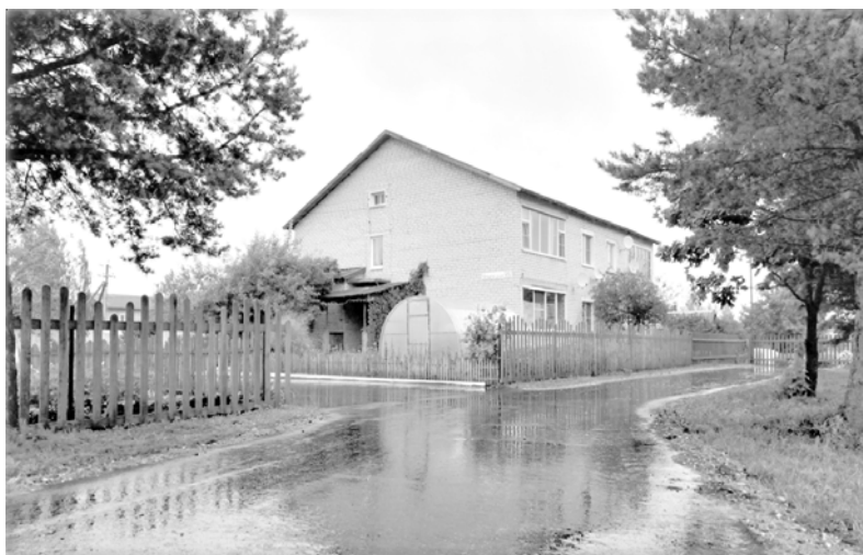
с.Большое Село, ул.Усыскина, д.35

У нас стало намного лучше, чем было: ровная дорога, на которой не стоят лужи, соответственно стало чище. Все сделано очень удобно. Теперь ждем, когда нам сделают освещение.