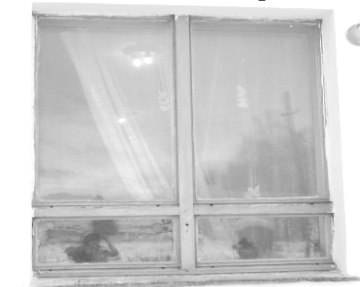
Окно в классе музыкальной школы. Слева - так было, справа - так стало

сельского поселения: «Все запланированные в рамках инициативного бюджетирования губернаторского проекта «Решаем вместе!» мероприятия реализованы. Проект очень помогает исполнительной власти в решении самых больших и острых проблем, связанных с благоустройством, улучшением качества жизни. Важно и то, что