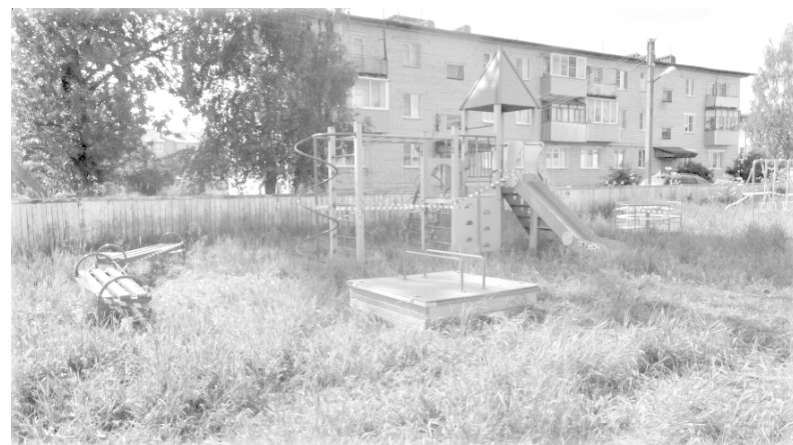
Детская площадка на ул. 2-я Полевая в Большом Селе до и после планировки.