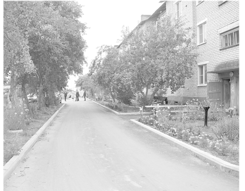
Дворовая территория на ул. Сурикова д.10а, Большое Село