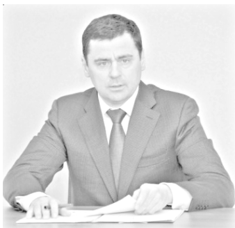
Губернатор Ярославской области Дмитрий МИРОНОВ

Желаю всем жителям региона мира и чистого неба, доброго здоровья и семейного счастья!