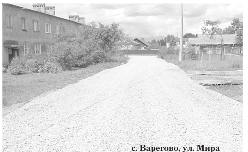
с. Варегово, ул. Мира

В селе Татищев Погост Ростовского района обустроили новую спортплощадку, а в селе Судино отремонтировали памятник воинам Великой Отечественной войны. В селе Поводнево Мышкинского района поменяли окна в здании Дома культуры, а в Мышкинском