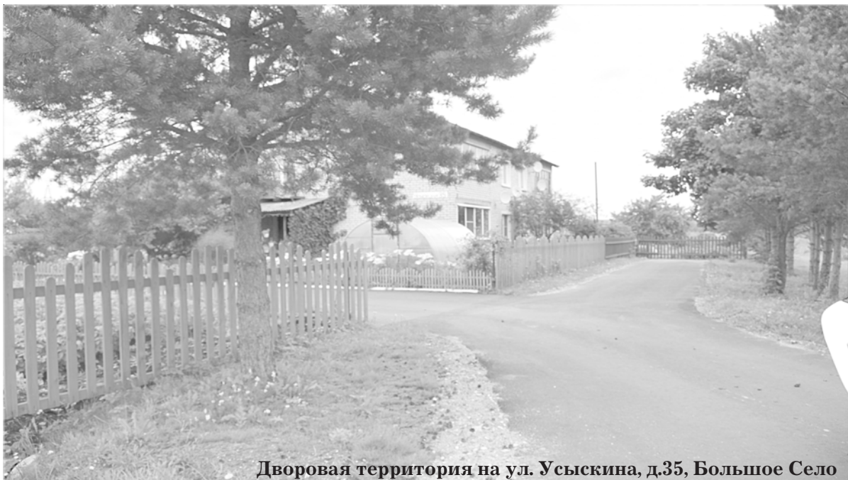
Дворовая территория на ул. Усыскина, д.35, Большое Село