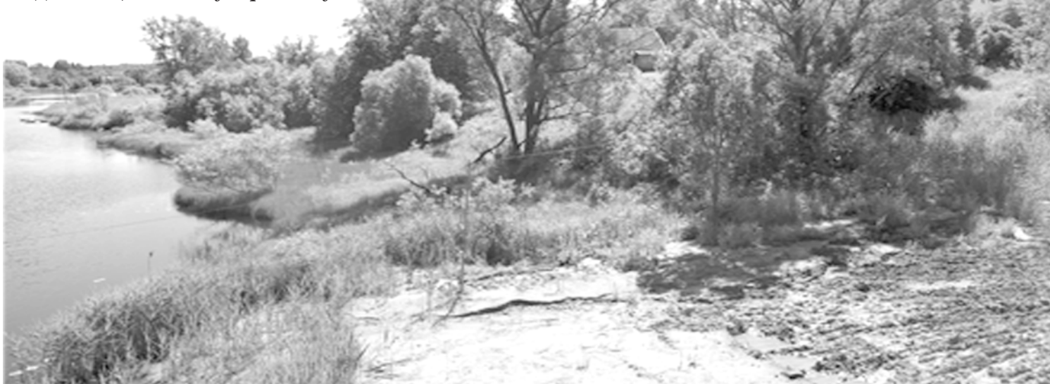
Левый берег реки Юхоть, подлежащий благоустройству

- Одним из условий выделения субсидии на дополнительные средства является проведение голосования. И принятие поправок к Конституции — очень удобный момент и повод, чтобы люди смогли за один раз выполнить две важные миссии — выразить свое мнение по поправкам и проголосовать за проект. Главная идея программы в том, что решение, в каком порядке будет проходить ремонт объектов, принимают жители. Поэтому вместе с голосованием по поправкам в Конституцию — с 25-го июня по 1 июля — жители района определяются с выбором объекта, на который потратят дополнительные 5 миллионов. Хотелось бы отметить ещё один нюанс столь раннего начала работы над проектами 2021 года. Как правило, после проведения всех подготовительных, процедур, проектных работ, согласований и так далее, проходит очень много времени. В результате работа над многими объектами затягивается и уходит в осень. Сейчас, определившись с объектом после голосования и подведения результатов, уже можно будет начинать весь комплекс подготовительных работ, и начать реализацию проекта уже весной.