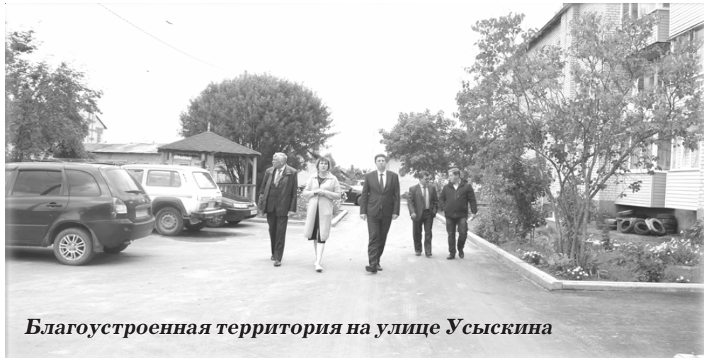
Благоустроенная территория на улице Усыскина

- Объекты выбраны не случайно. Именно неравнодушные активные жители выступали и обращались с просьбами включить в планы по благоустройству и реализации программы «Решаем вместе!» данные объекты. Реализовать их планировалось уже давно, но не было финансовой возможности их обустроить.