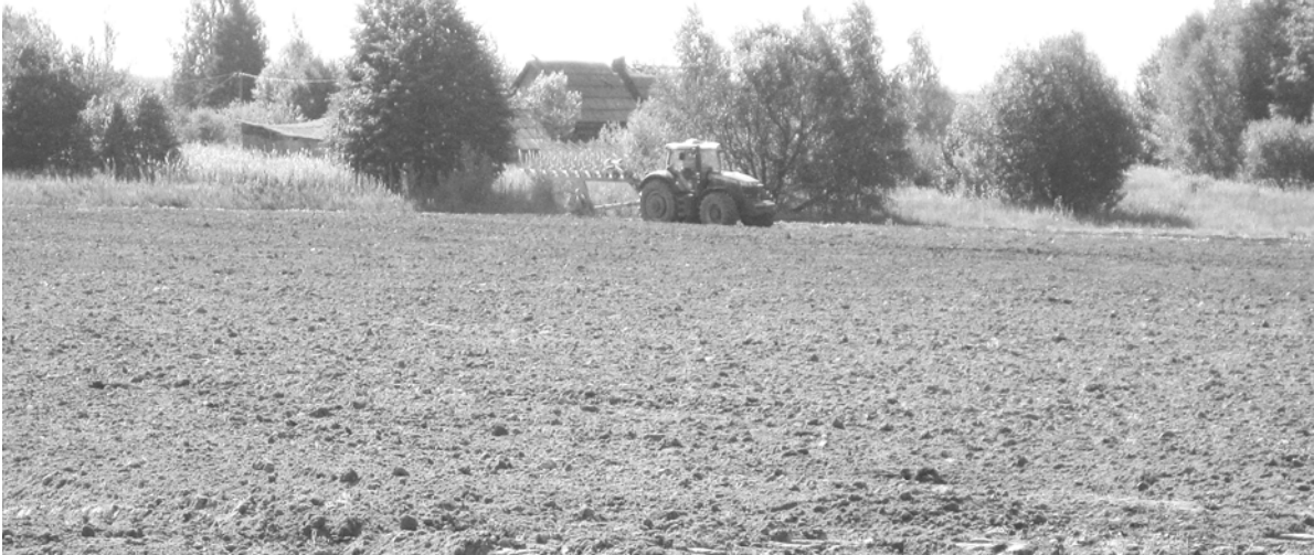
Подготовка почвы под озимые культуры