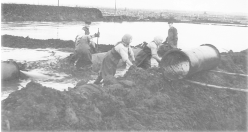
Работы на Вареговском торфопредприятии